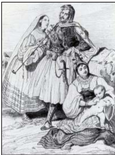
Në foto: Familje shqiptare, 1834

5. Prandaj ka çdo arsye, për të ardhur në përfundimin se shqiptarët, jo vetëm ishin të parët prej popujve europianë që e pranuan ungjillin, por edhe që e shpërn-