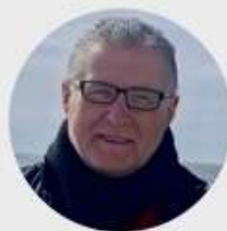
NdreK Gjini Shkrimtar